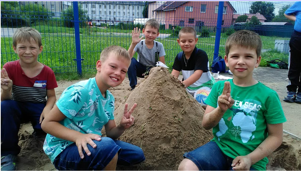
6 июля «День талантов»