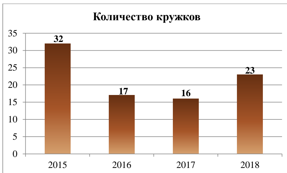
Диаграмма количества кружков за 3 года